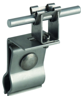
Az ábrák nem kötelező érvényűek